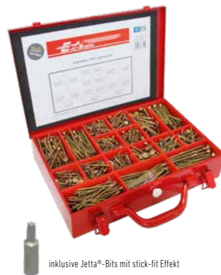
inklusive Jetta®-Bits mit stick-fit Effekt